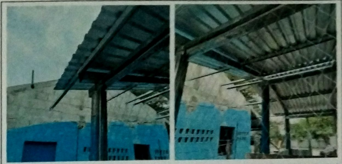
Foto 2: MODULO DE COCINA, Vista exterior de cubierta de lamina troquelada cal 26, con estructura de metal a base de costaneras, mas cerramiento de malla metalica cal 12.