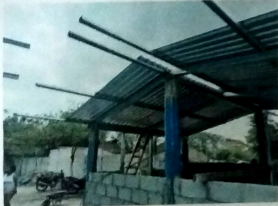
Foto 3: MODULO DE COCINA, Vista exterior de cubierta de lamina troquelada cal 26, con estructura de metal a base de costaneras cerramiento de block pomez.