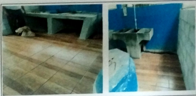
Foto 9: MODULO DE COCINA, Vista exterior de cubierta de lamina troquelada cal 26, con estructura de metal a base de costaneras, instalacion de piso ceramico. Ejecucion de mueble de concreto, mas instalacion de pila.