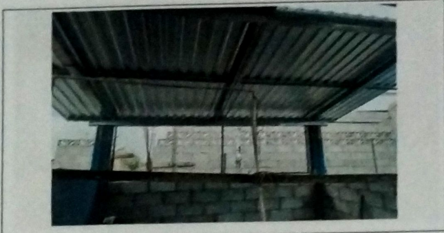
Foto 7: MODULO DE COCINA, Vista exterior de cubierta de lamina troquelada cal 26, con estructura de metal a base de costaneras