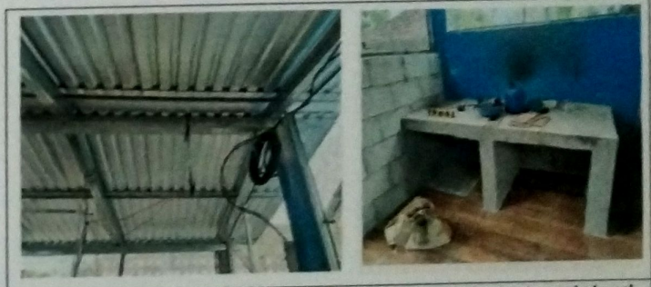
Foto 10: MODULO DE COCINA, Vista exterior de cubierta de lamina troquelada cal 26, con estructura de metal a base de costaneras, instalacion de piso ceramico. Ejecucion de mueble de concreto-