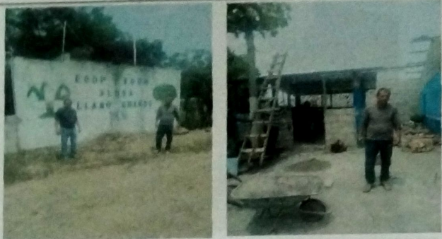
Foto1: VISTA EXTERIOR DE IDENTIFICACION DE ESCUELA, VISTA EXTERIOR DE MODULO DE COCINA REMOZADA.