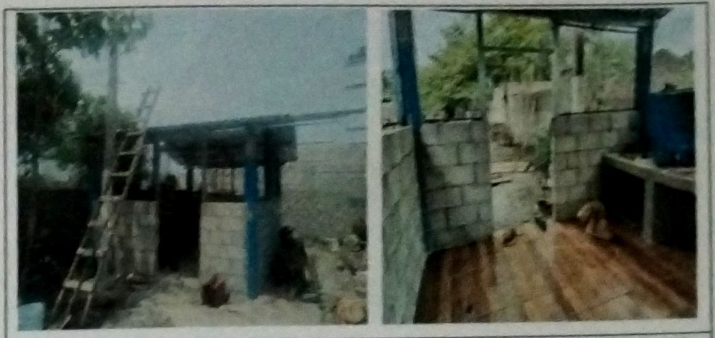
Foto 8: MODULO DE COCINA, Vista exterior de cubierta de lamina troquelada cal 26, con estructura de metal a base de costaneras, instalacion de piso ceramico.