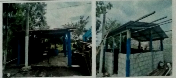
Foto 4: MODULO DE COCINA, Vista exterior de cubierta de lamina troquelada cal 26, con estructura de metal a base de costaneras, cerramiento de block pomez.