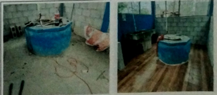
Foto 6: MODULO DE COCINA, Vista Interior de Cocina, instalacion de piso ceramico.cerramiento de block pomez.