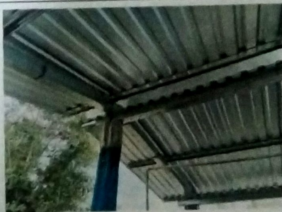
Foto 5: MODULO DE COCINA, Vista exterior de cubierta de lamina troquelada cal 26, con estructura de metal a base de costaneras